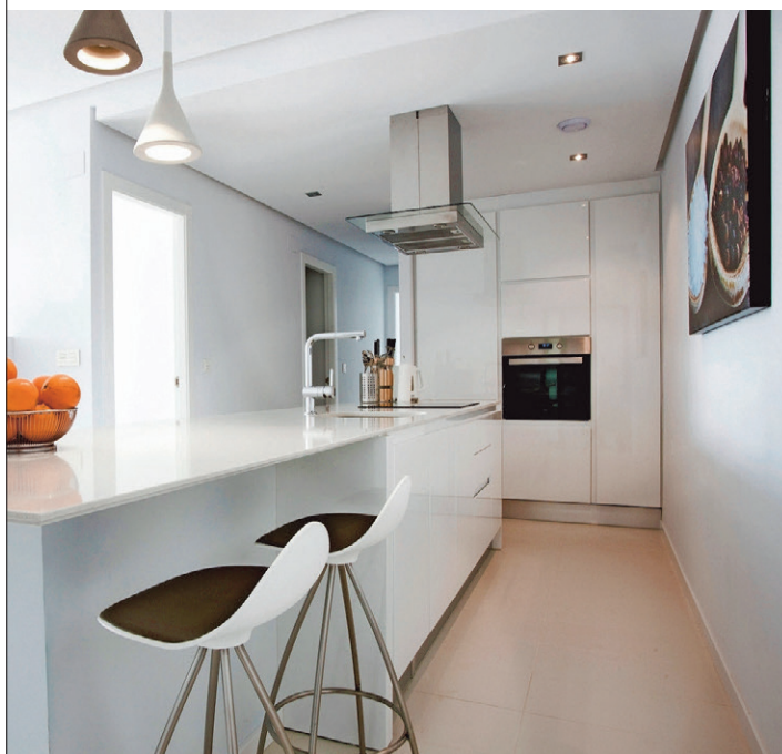
Het appartement oogt minimalistisch-strak. Een groot contrast met het meer klassieke huis van Karen en Eric in Schilde.

Als je een tweede verblijf in Spanje koopt, moet je rekenen op zo'n 15 procent bijkomende kosten. Heel belangrijk is dat je een advocaat onder de arm neemt, want de rol van de notaris is beperkt. Een advocaat verricht heel wat administratief werk en pluist uit of je honderd procent veilig kunt kopen. In Spanje neem je als nieuwe eigenaar de schulden over van de verkoper en dat kan natuurlijk niet de bedoeling zijn. Om een huis te reserveren, betaal je zo'n 3.000 euro. Nadien heb je vier weken de tijd om het volledige bedrag over te maken op een derdenrekening die door de advocaat wordt beheerd. Na die betaling duurt het nog een maand voor je de sleutels overhandigd krijgt als het om een afgewerkt gebouw gaat. Meer info: www.hipestates.com en 0800/62 500