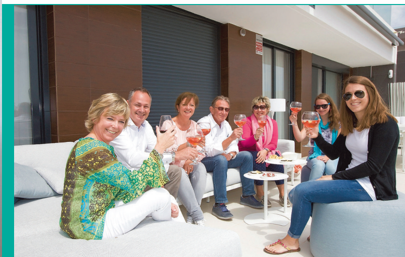
Met de hele familie en nog enkele vrienden aperitiefen op het riante terras van 55 m 2 met het buitenmeubilair van Tribu.