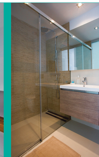
De badkamer is de enige ruimte waar wit niet domineert.