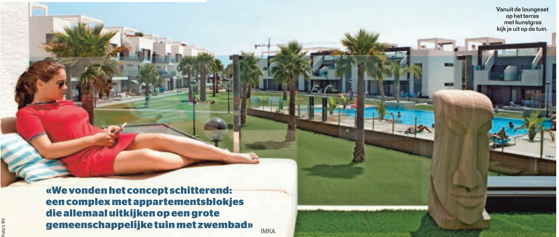
Vanuit de loungeset op het terras met kunstgras kijk je uit op de tuin.

«We vonden het concept schitterend: een complex met appartementsblokjes die allemaal uitkijken op een grote gemeenschappelijke tuin met zwembad»