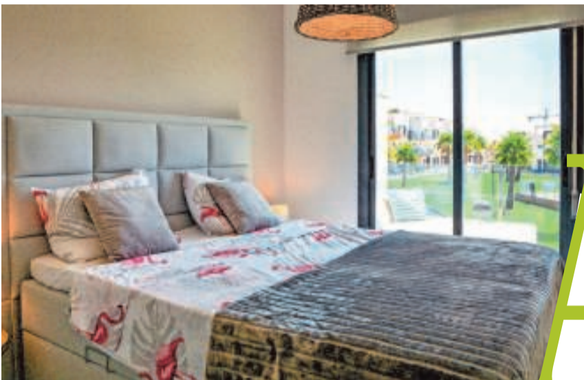
De slaapkamer geeft uit op het terras. Onder het bed zit extra opbergruimte verscholen.

Jarenlang lieten Imka en Xavier Spanje links liggen, maar toch kochten ze net daar een appartement. In een modern nieuwbouwcomplex, met zicht op een grote tuin met zwembad, geniet het gezin van de weinige tijd samen en de contacten met de vele Belgen die ze aan de Costa Blanca leerden kennen.