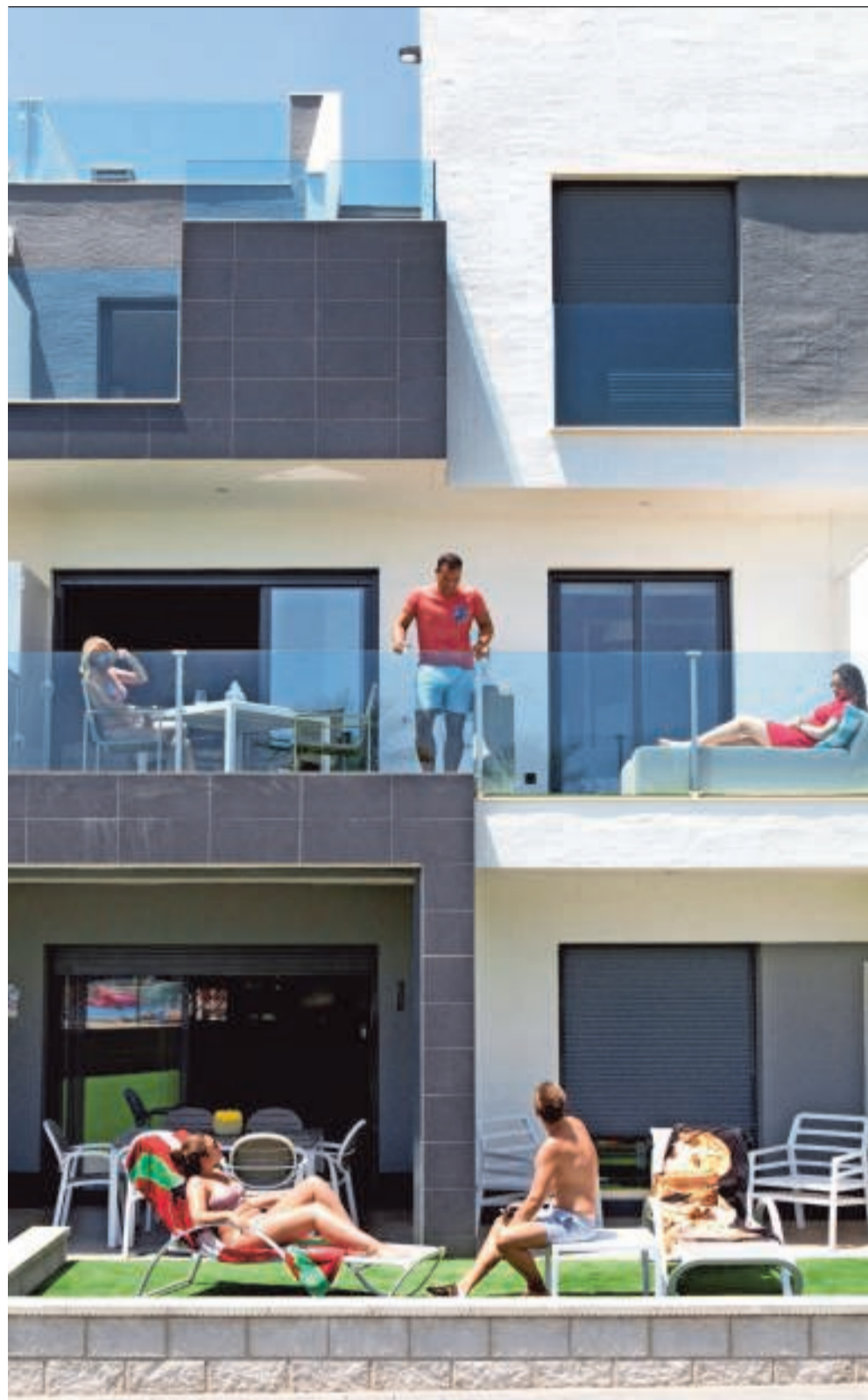
Zowat acht op de tien eigenaars zijn Belgen. Geen wonder dat er nieuwe vriendschappen ontstaan.